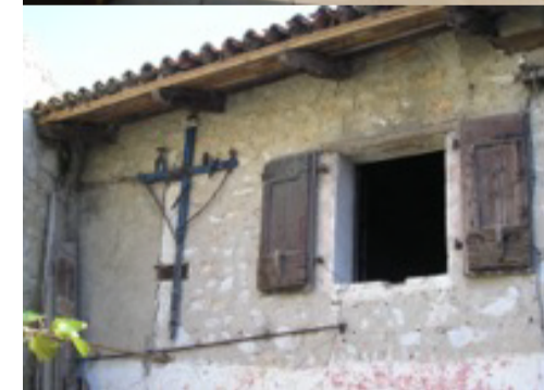
- vista da BREG in piccolo borgo di Golo Brdo in riva al Judrio, a destra il Santuario di Santa Maria sul Lago, a sinistra il Castello di Albana - Prepotto - Kojško, veduta del Collio dalla Chiesetta della Santa Croce - Versa, facciata di casa in Via Gorizia, particolare